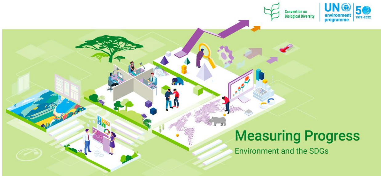
Доклад «Измерение прогресса II»

Комплексный анализ хода осуществления Повестки дня на период до 2030 года